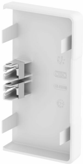
Topo para fecho lateral das calhas Rapid 45-2 GK e GA 53100.