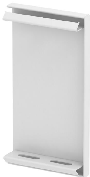
Topo para calha técnica GS.