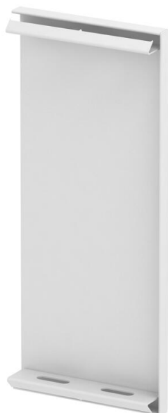
Topo para calha técnica GS.