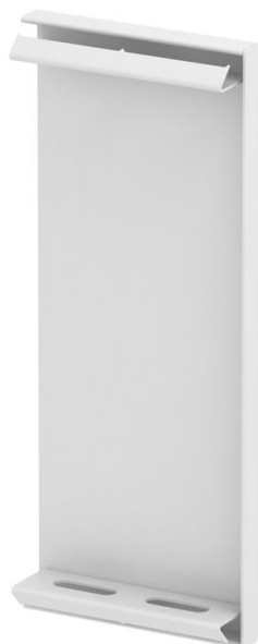
Topo para calha técnica GS.